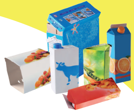
Emballages en cartons

Ne doivent pas être jetés dans la poubelle jaune :