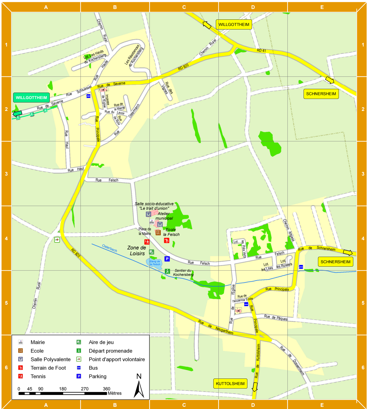
Les 33 villages de la Communauté de communes du Kochersberg